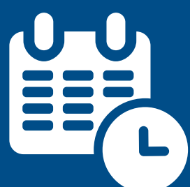
Datum a čas