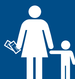
Podmínky pro cestování s dětmi

2 Provedu odbavení online nebo prostřednictvím samoobslužných kiosků na letišti, pokud to aerolinka umožňuje.