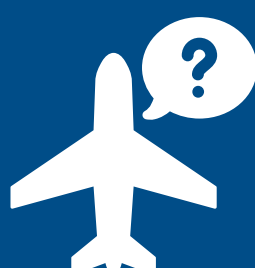
Název letecké společnosti