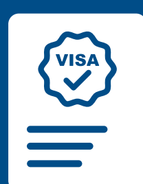
Víza a platný cestovní doklad