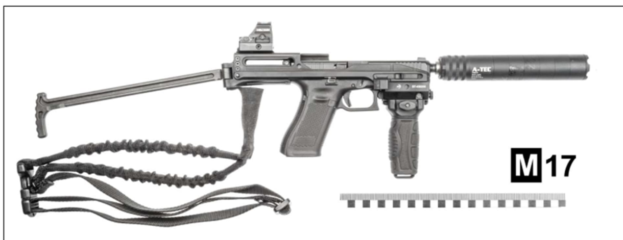
Foto č. 69, 70: celkový pohled z levé strany (nahore) a pravé strany (dole) na předloženou samonabíjecí pistoli GLOCK model 47, v.č. CANR868, ráže 9 mm Luger, s našroubovaným tlumičem hluku výstřelu A-TEC typ PMM-6 na ústí hlavně, která je uchycena v karabinové konverzi B&T USW-G17 s mikro-kolimátorem HOLOSUN model HS507C X2, přední taktickou rukojetí zn. KIRO a nosným popruhem zn. Blackhawk

Proto se někteří svědci domnívali, že “v ruce držel zbraň, držel to jako kulomet” . Tato výpověď může být důsledkem způsobu, jakým vrah zbraň držel a používal. Kombinace tlumiče a dalších přídatných zařízení mohla opticky zbraň zvětšit, což vedlo svědky k takovému dojmu.