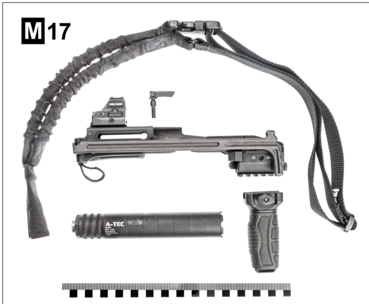
Foto č. 72: celkový pohled na jednotlivé příslušenství sejmuté z pistole - karabinovou konverzi B&T USW-G17 se sklopenou ramenní opěrku, napínací pákou a kolimátorem HOLOSUN model HS507C X2 (na fotu uprostřed); tlumič hluku výstřelu A-TECH PMM-6 (na fotu vlevo dole); přední taktickou rukojeť zn. KIRO (na fotu vpravo dole) a nosný popruh zn. Blackhawk typ STORM (na fotu nahoře)

Vrah však neomezil použití pouze na kolimátor a tlumič. Na zbraň byla přidána i další přídatná zařízení, která ještě více zvýšila její efektivitu při útoku. Seznam těchto zařízení je zobrazen na dalším obrázku níže.