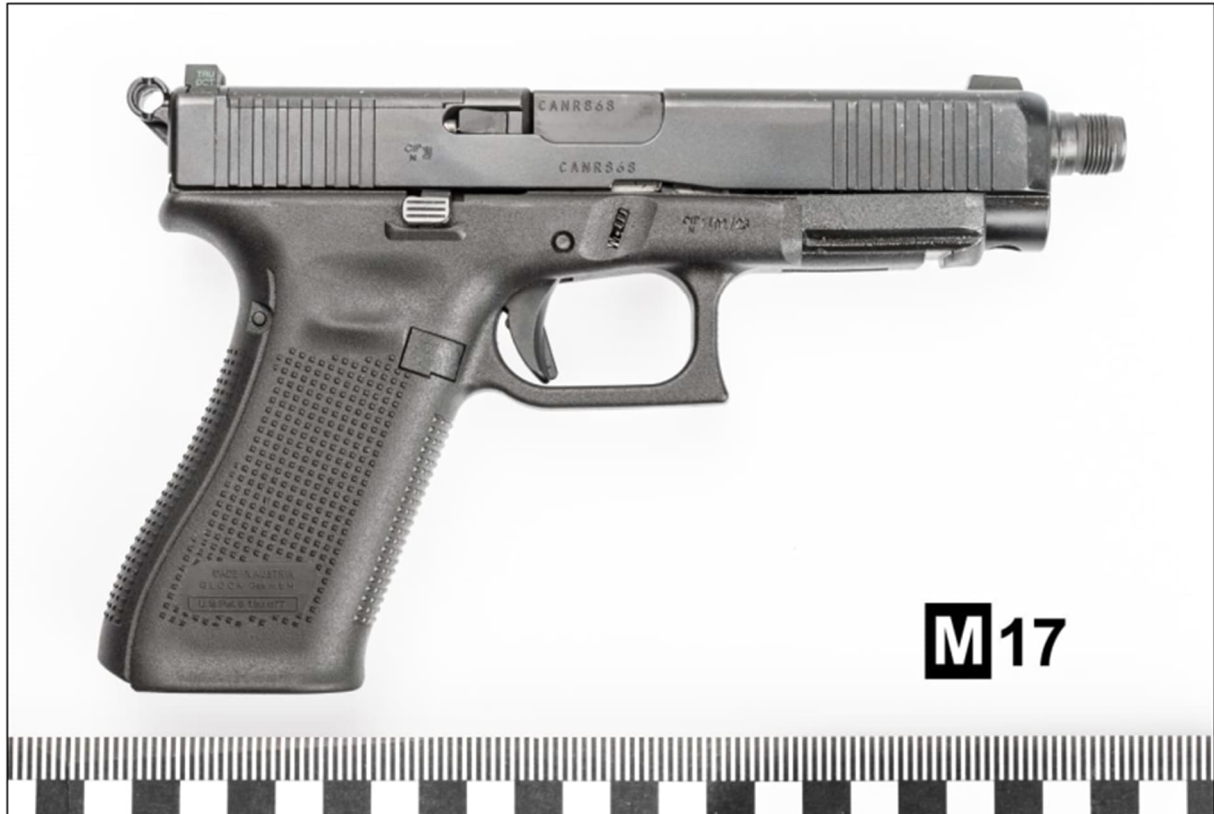
Foto č. 71: celkový pohled z pravé na předloženou samonabíjecí pistoli GLOCK model 47, v.č. CANR868, ráže 9 mm Luger, s odšroubovaným tlumičem hluku výstřelů, vyjmutou z karabinové konverze

Toto je zbraň, kterou pachatel na FF UK střílel: 2